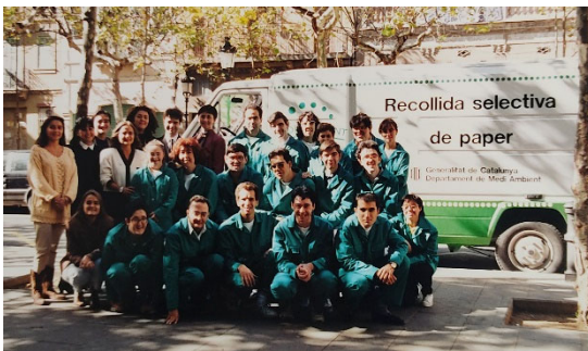
Primer equipo del Servicio de Recogida Selectiva de Femarec a principios de los años noventa

Tal y como hemos apuntado anteriormente, éste fue uno de los primeros servicios dirigidos a las empresas que pusimos en funcionamiento.