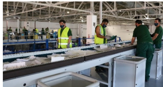
Diversas perspectivas de las actuales instalaciones destinadas a la Gestión de Residuos de Femarec

Cabe mencionar también que disponemos de un almacén especialmente acondicionado para albergar residuos especiales y/o peligrosos que es el único situado en el área metropolitana de Barcelona.