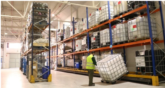
Almacén de productos especiales y/o peligrosos

Cabe mencionar también que disponemos de un almacén especialmente acondicionado para albergar residuos especiales y/o peligrosos que es el único situado en el área metropolitana de Barcelona.